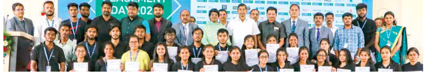
மாணவர்களுக்கு பணி நியமன ஆணை வழங்கிய போது எடுக்கப்பட்ட குழு புகைப்படம்