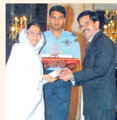
Receiving Dr. B. C. Roy National Award from the President of India, July 2008