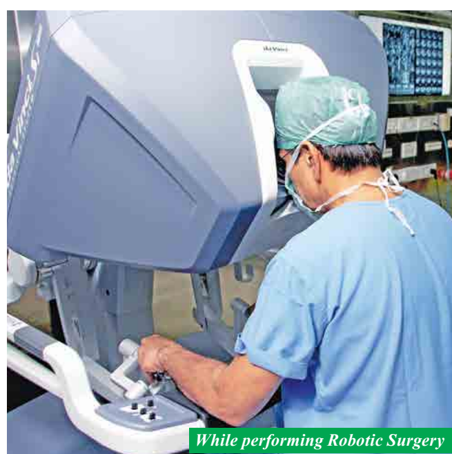
While performing Robotic Surgery