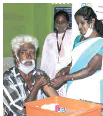
Rathinam NSS team along with Eye Foundation members during the Eye Check Up camp.