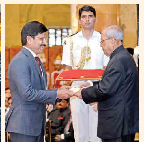
Receiving the Dr. B. C. Roy National Award for the second time

year - Close the care gap. Also his hospital has created a virtual platform ahead of World Cancer Day (Feb.4) wherein people can participate freely, and explore the causes of various cancers, their symptoms, treatments etc. Throughout this month, they can ask for free cancer guidance and consultation, and it will be provided.