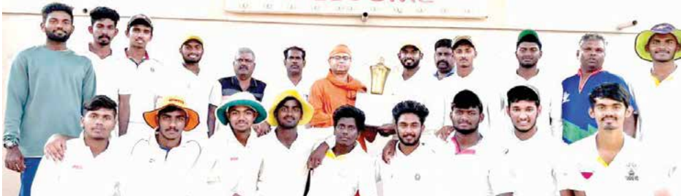
பாரதியார் பல்கலைக்கழக 'ஏ' மண்டல டி.வென்டி கிரிக்கெட் போட்டியில் சாம்பியன் பட்டம் வென்ற ஸ்ரீ ராமகிருஷ்ணா கலை மற்றும் அறிவியல் கல்லூரி அணியினர்.