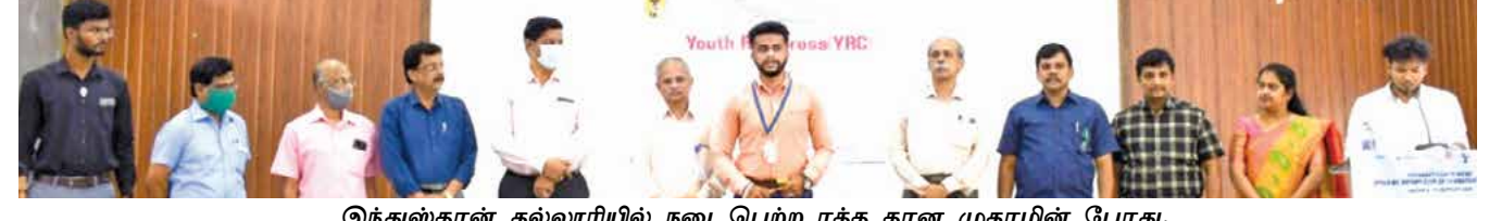
இந்துஸ்தான் கல்லூரியில் நடைபெற்ற ரத்த தான முகாமின் போது.