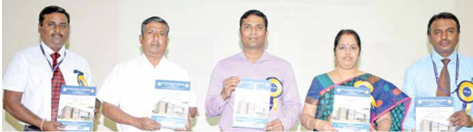
நிகழ்ச்சியில் கருத்தரங்க மலரை வெளியிடும் போது.