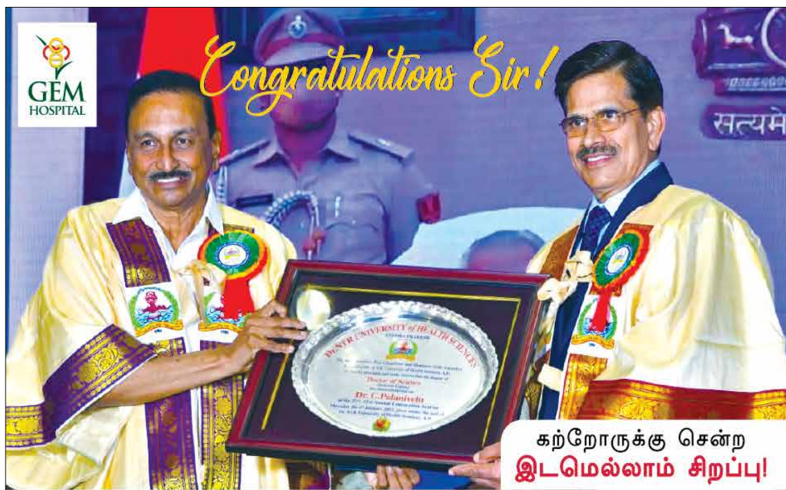
கற்றோருக்கு சென்ற இடமெல்லாம் சிறப்பு!

தலைவர்கள் பலரும் கண்டனம் தெரிவித்து வருகின்றனர். விடுதலைப் போரில் தமிழகத்தின் பங்களிப்பு இருட்டடிப்பு செய்யப்படுவதாக அவர்கள் குற்றஞ்சாட்டியுள்ளனர். இந்திய சுதந்திரப் போராட்டத்தில் முக்கிய பங்கு வகித்த தமிழகம், மேற்கு வங்கம், கேரளம் ஆகிய மாநிலங்களைச் சேர்ந்த சுதந்திரப் போராட்ட வீரர்களின் தியாகத்தை மத்திய அரசு அங்கீகரிக்க மனமில்லாமல்