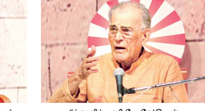
6ம் நாளில் மணி, போதேந்திராள் பற்றி பேசினார்.