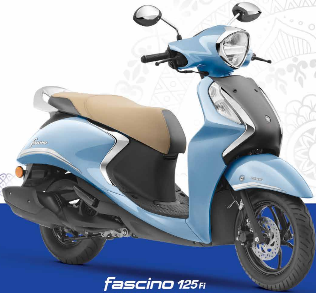
fascino 125Fi HYBRID

*LIMITED PERIOD OFFER. Terms & Conditions Apply.