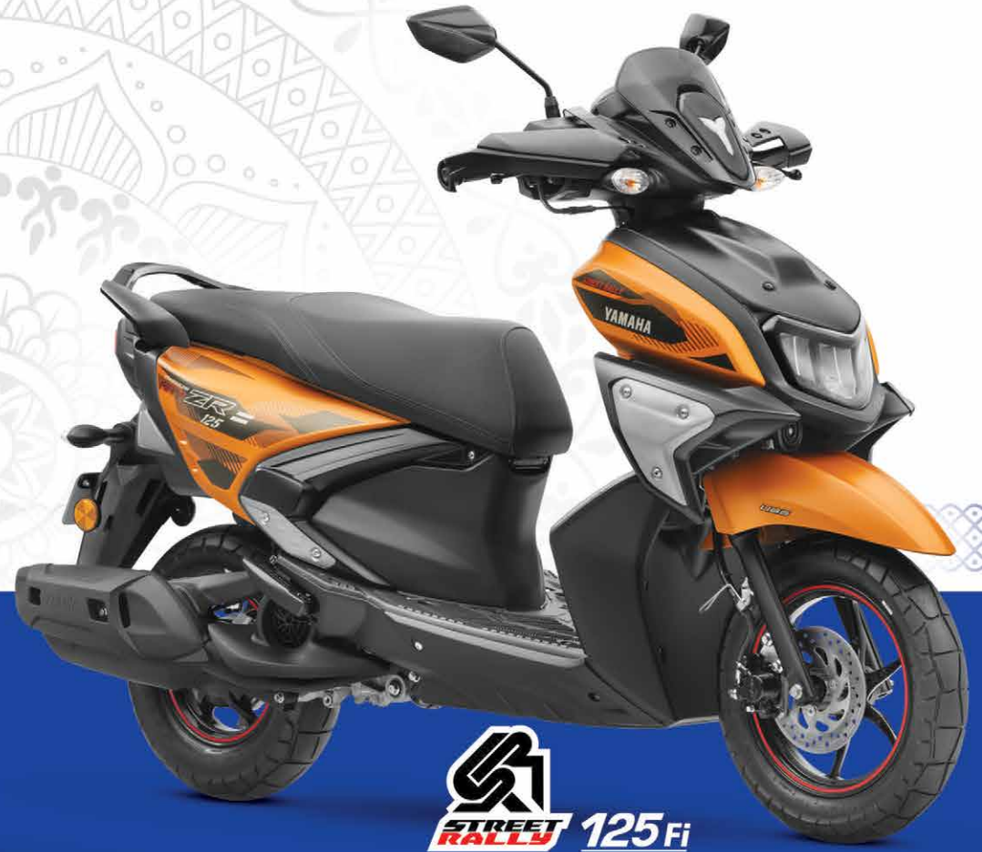
R15 125Fi HYBRID

SUPERIOR MILEAGE WITH AUTOMATIC STOP & START SYSTEM