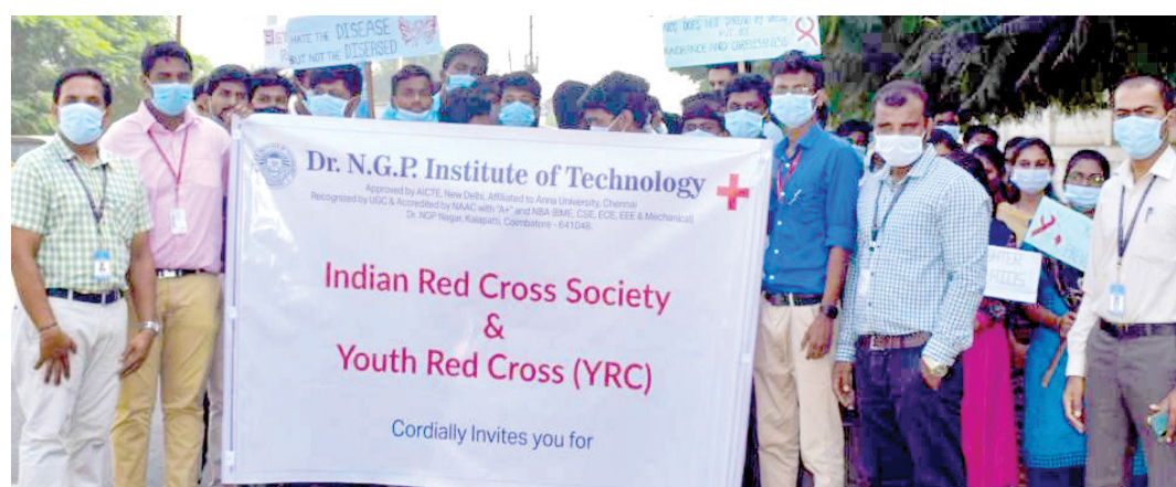
The students along with the faculty during the rally.