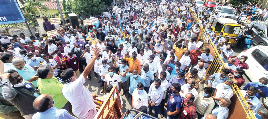
முலப்பொருட்கள் விலை உயர்வைக் கண்டித்து கோவையில் 50 ஆயிரத்திற்கும் மேற்பட்ட சிறு, குறு தொழில் நிறுவனங்கள் ஒரு நாள் வேலை நிறுத்தப் போராட்டத்தில் அண்மையில் ஈடுபட்டனர். இதில் பல்வேறு கோரிக்கைகளை வலியுறுத்தி கோவை தெற்கு வட்டாட்சியர் அலுவலகம் முன்பு தொழில் முனைவோர்கள் கவன ஈர்ப்பு ஆர்ப்பாட்டம் நடத்தினர்.