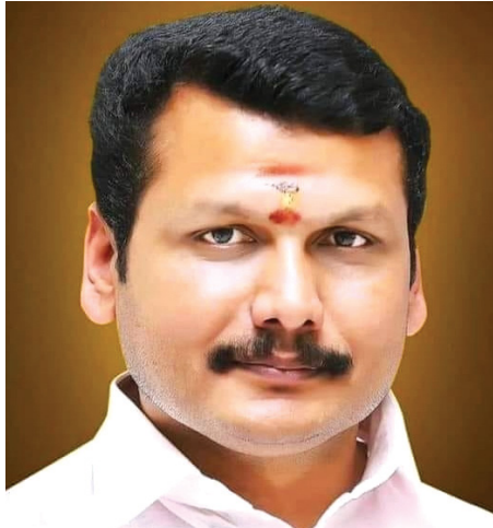
ஆளுங்கட்சியின் மதிப்பை உயர்த்தி, மக்களுடைய நம்பிக்கையைப் பெற உதவும்.

கோவைக்கு பல தேவைகள் இருந்தாலும் சாலை வசதி என்பது மிக முக்கியமான, அவசியமான தேவையாகும். கூடவே உள்ளாட்சித் தேர்தல் வரவுள்ள சூழலில் இதில் கவனம் செலுத்த வேண்டியது ஆளுங்கட்சியின் மதிப்பை உயர்த்தி, மக்களுடைய நம்பிக்கையை பெற உதவும்.