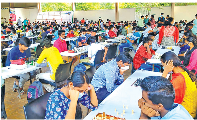
A vast number of players engaged at the tournament