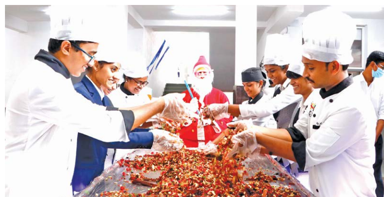
The students of Catering Department during the fruits mixing ceremony.