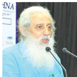
young faculty and also recommended updating series for experienced faculty.

He deliberated about different initiatives of AICTE for faculty, students, institution and the society. Further talking about the faculty development programmes He exclusively insisted on continuous training modules for