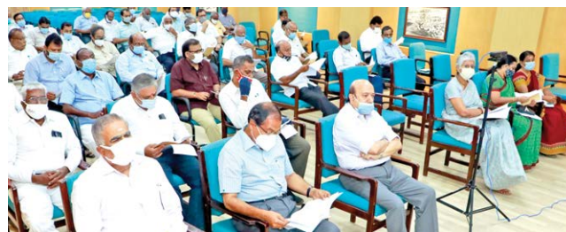
Esteemed Members of ICCIC during the AGM

He shared that Chamber had been of incredible support to the District Administration to contribute Relief measures