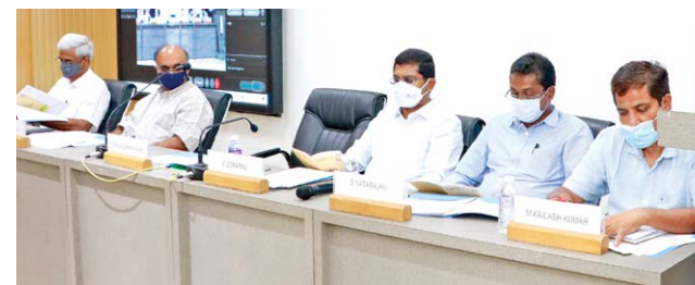
Office bearers of the Association

He also pointed out that the Chamber participated in the