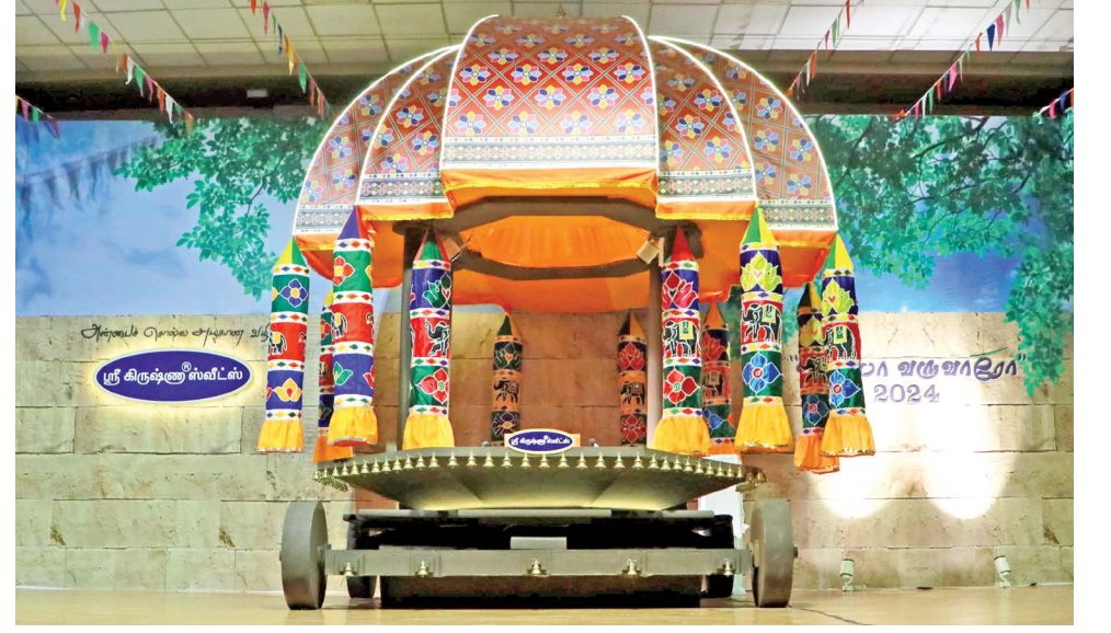
“எப்போ வருவாரோ 2024” சொற்பொழிவு நிகழ்ச்சியின் ஆழித்தேர் மேடை அமைப்பு.