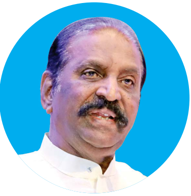
- கவிஞர் வைரமுத்து

கே.ஜி. மருத்துவமனைக்குள் நுழைந்தவர்கள் பெரும்பாலும் நலம் பெற்றுத் திரும்புகிறார்கள் என்ற நல்ல கருத்து, அந்த மருத்துவமனைக்குக் கூடுதல் சிறப்பை தருகிறது. கோயம்புத்தூருக்குப் பெருமை சேர்க்கும் அடையாளங்கள் சில உண்டு. அந்த பெருமை சேர்க்கும் அடையாளங்களில் ஒன்றாக விளங்கும் நம்முடைய கே.ஜி. மருத்துவமனை பொன்விழா அல்ல.. மேலும் மேலும் முத்து விழா, பவள விழா, நூற்றாண்டு விழா கண்டு மக்களுக்குத் தொண்டாற்ற வேண்டும் என வாழ்த்துகிறேன். பணிபுரியும் பெருமக்களை வணங்குகிறேன்.