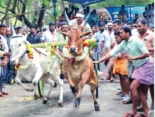
கே.பி.ஆர். கல்லூரியில் நடைபெற்ற ரேக்ளா ரேஸில் சிறப்பாயும் காண்க

மாவட்டங்களிலிருந்து 400க்கும் மேற்பட்ட போட்டியாளர்கள் கலந்துகொண்டனர். வெற்றிபெற்றோருக்கு முதல் பரிசாக ஹோண்டா ஆக்டிவா, இரண்டாம் பரிசாக ஒரு பவுன் தங்க நாணயம், மூன்றாம் பரிசாக 3/4 பவுன் தங்க நாணயம், நான்காம் பரிசாக 1/2 பவுன் தங்க நாணயம், ஐந்தாம் பரிசாக 1/4 பவுன் தங்க நாணயம், ஆறு முதல் பத்தாம் பரிசாக 1 கிராம் தங்க நாணயங்கள் வழங்கப்பட்டன. மேலும் முதல் 30 இடங்களைப் பிடித்த போட்டியாளர்களுக்கு வெள்ளிநாணயங்கள் பரிசாக வழங்கிச் சிறப்பிக்கப்பட்டன.