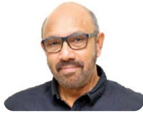
- சத்யராஜ், நடிகர்

கே.ஜி. மருத்துவமனையின் சேவை தொடர்ந்து சிறப்பாக நடந்து வருகிறது. குறிப்பாக, 1986ல் முத்துக்கள் மூன்று என்ற படத்தின் படப்பிடிப்பின் போது நடிகர் திலகம் சிவாஜி கணேசன் அவர்களுக்கு உடல்நலக் குறைவு ஏற்பட்டது. உடனடியாக, கே.ஜி. மருத்துவமனையில் அனுமதித்து சிகிச்சை பார்த்தோம். இன்று வரை, என் குடும்பத்தினருக்கு ஏதேனும் உடல் நலம் சரியில்லை என்றால் கே.ஜி. மருத்துவமனையைத்தான் அணுகுவோம். கோயம்புத்தூரின் பெருமை கே.ஜி. மருத்துவமனை. வாழ்த்துக்கள்.