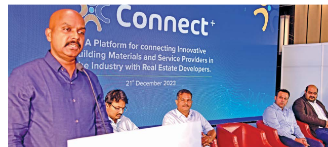
V. Balakrishnan, IPS, Commissioner of Police while addressing the meet