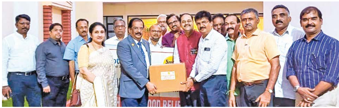
Rotary Clubs of Coimbatore has sent relief goods worth Rs.45 lakh to the flood affected areas.