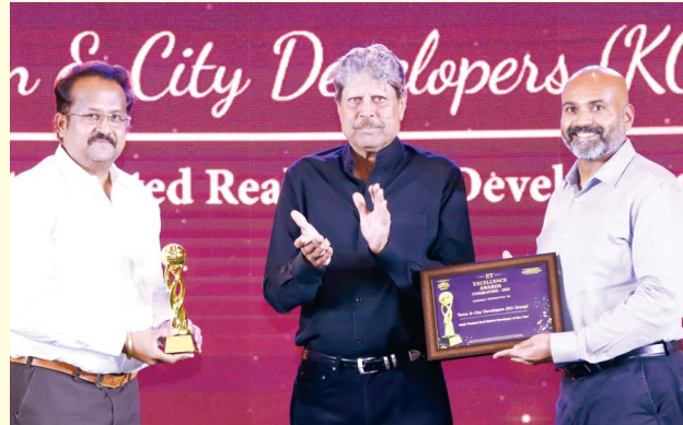
டவுன் அண்ட் சிட்டி டெவலப்மென்ட்டுக்கு (கே.ஜி. குழுமம்) 'மோஸ்ட் டிரஸ்டட் ரியல் எஸ்டேட் டெவலப்மென்ட் ஆப் தி இயர்' எனும் விருது வழங்கப்பட்டுள்ளது.