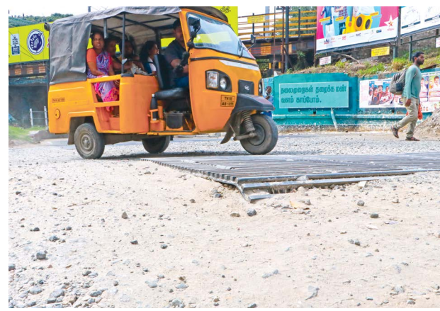
லங்கா கார்னர் பகுதியில் சாலைகள் குண்டும் குழியுமாக, கம்பிகள் நீட்டியபடி ஆபத்தான நிலையில் உள்ளதால் வாகன ஓட்டிகள் மிகவும் சிரமத்திற்கு உள்ளாகிறார்கள்.