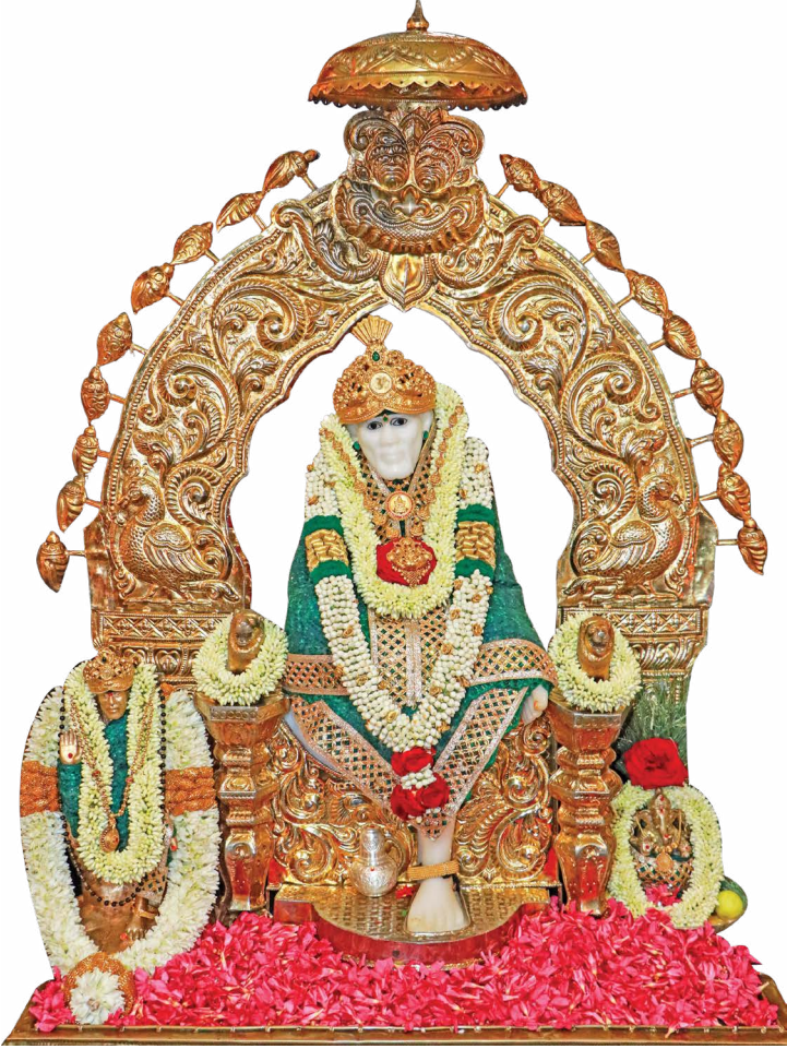
ஆனந்த சாய் பாபா