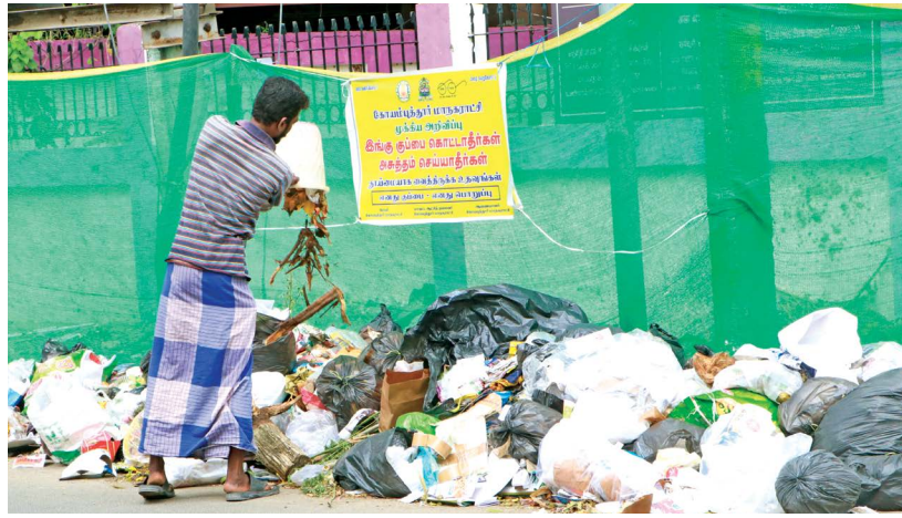
டாடாபாத் சாலையில், இ.எஸ்.ஐ. அலுவலகம் முன்பு மாநகராட்சியின் "கூப்பையை கொட்டாதீர்" என்ற அறிவிப்புப் பலகையின் முன்பே குவிந்திருக்கும் கூப்பைகளின் மீது தனது கடமையை செய்யும் குடிமகன்!