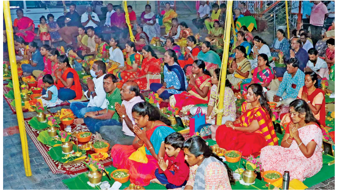
பூஜையில் கலந்துகொண்ட பக்தர்கள்