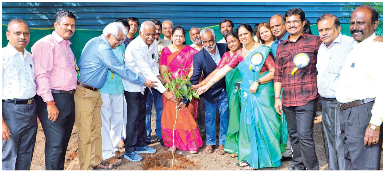
Members of the association and PSGCAS College Principal Brinda plant a sapling in the college campus as part of the Alumni Reunion event.