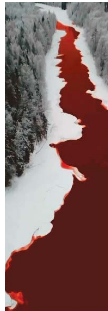
தொழில் நகரமாக இருக்கும் கெமரோவோவில் தொழிற்சாலையில் இருந்து கழிவுகள் ஆறுகளில் விடப்படுகிறது. அதனால், ஆறுகளில் நச்சுக் கழிவுகள் கலந்து, நச்சு நீராக மாறி மக்களை அச்சுறுத்தி வருகிறது. இதன் காரணமாகவும், இல்கியும் கா நதி நிறம் மாறி இருக்கலாம் எனக் கருதப்படுகிறது. இதற்கான, ஆய்வுகள் நடந்து வருகிறது. நீர் நிறம் மாற்றம் காரணமாக, நதியில் வாத்துகள் இறங்க மறுக்கின்றன என அப்பகுதி மக்கள் கூறுகிறார்கள். இறைவன் நமக்கு அளித்த விவமைதப்பில்லா அன்பளிப்பு, இயற்கை. அந்த இயற்கையை உலகம் எங்கும் காப்பாற்றுவது நமது ஒப்பொருவரின் கடமையாகும்.

பெருகிவரும் பெ.தொழிற்சாலைகள் மக்களின் வாழ்வாதாரத்தை மேம்படுத்தும் என்பதிலும்; ஒரு நாட்டின் பொருளாதாரம், அந்நாட்டின் தொழில் வளம் சார்ந்து இருக்கிறது என்பதிலும் எவ்வளவு சந்தேகமும் இல்லை. அதே நேரத்தில், தொழிற்சாலைகளில் இருந்து வெளியேற்றப்படும் கழிவுகள் இயற்கை வளத்தைச் சீர்கெடுக்கின்றன என்பதையும் கருத்தில் கொள்ள வேண்டும். 50 ஆண்டுகளுக்கு முன்பு இருந்த இயற்கைச் சூழல் தற்போது இல்லை. இன்று இருக்கும் இயற்கை வளம் வரும் காலங்களில் இருக்குமா என்பதும் சந்தேகமே?!