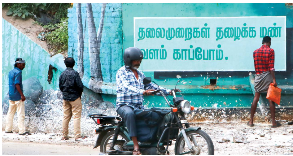
லங்கா கார்னர் பகுதியில் சாலையோரத்தில் வரிசையாக நின்று சிறுநீர் கழிக்கும் பொதுமக்கள்.