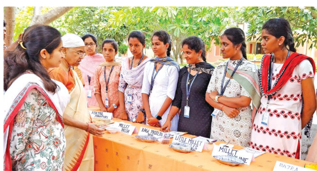
The judging panel members examining the millet products prepared by students of the Department of Food Science and Nutrition and Biochemistry in the Millet Exhibition