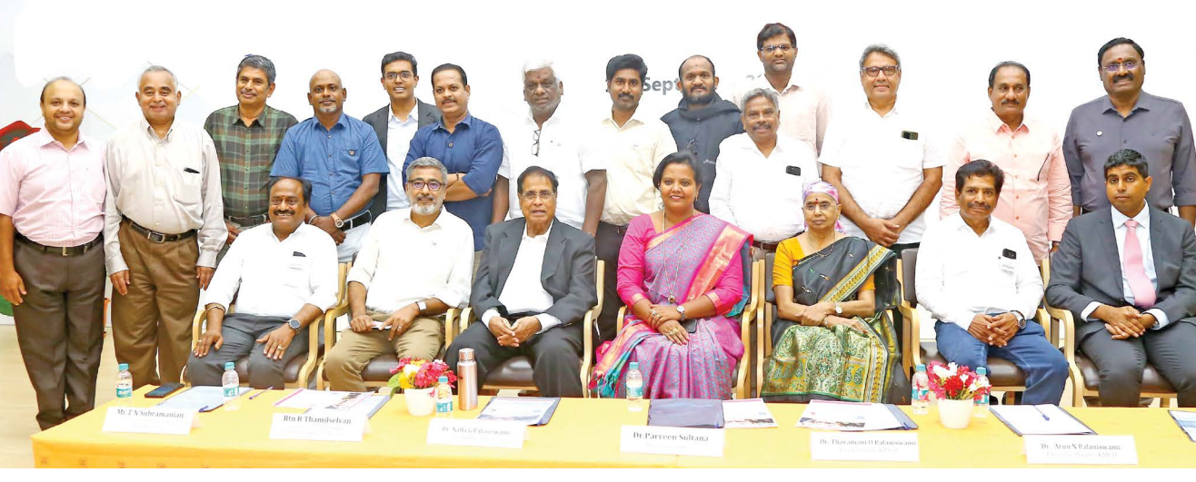
நிகழ்வில் ரோட்டரி கிளப் கோயமுத்தூர் மெரிடியன் மற்றும் ஆட்டிடியூட் சாரிடபிள் டிரஸ்ட் ஆகிய அமைப்புகளின் உறுப்பினர்களுடன் எடுத்துக்கொண்ட குழு புகைப்படம்.

மூலம் கே.எம்.சி.ஹெச். அளிக்கும் புற்றுநோய் மருத்துவம் மேலும் முழுமைபெற்ற சேவை மையமாகத் திகழும் என்பதில் எவ்வித மாற்றுக் கருத்தும் இல்லை. அண்மையில், பிரபல நாளிதழ் நடத்திய சர்வே ஒன்றில் புற்றுநோய் சிகிச்சை வழங்கும் மருத்துவமனைகளில், குறிப்பாக தென்னிந்தியாவில், மிகச் சிறந்த மூன்றாவது மருத்துவ மையமாக கே.எம்.சி.ஹெச். மருத்துவமனையை அங்கீகரித்திருப்பது குறிப்பிடத்தக்கது.