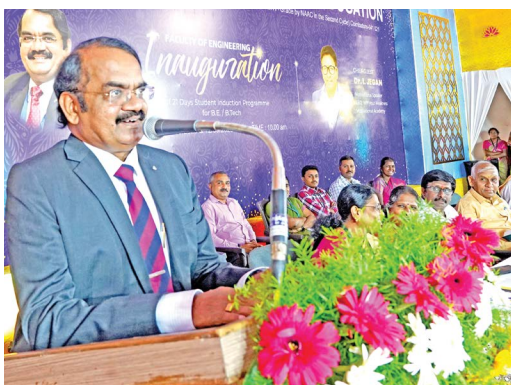
முதலாமாண்டு வரவேற்பு விழாவில் சிறப்பு விருந்தினரான இஸ்ரோ அமைப்பின் முன்னாள் இயக்குனர் மயில்சாமி அண்ணாதுரை மாணவர்களிடம் உரையாற்றுகிறார்.