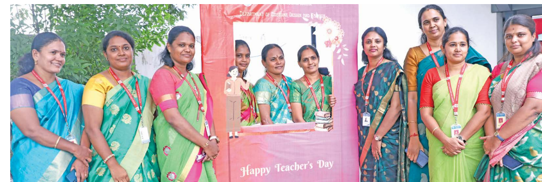
Teachers joyfully takes photographs in the selfie photo frame