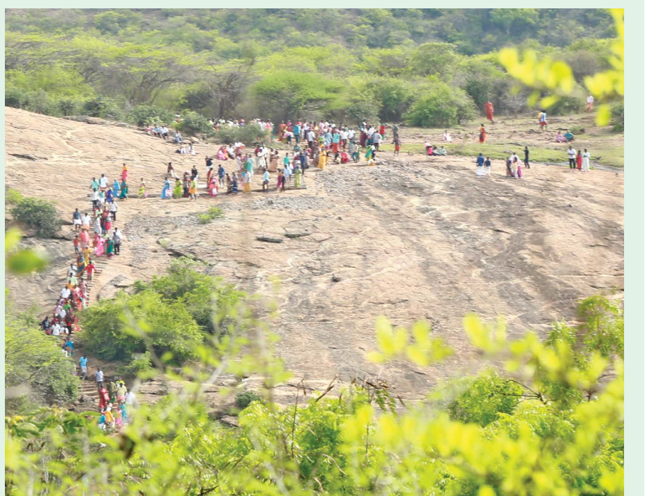
பெளர்ணமி நாளில் தர்மலிங்க மலையை சுற்றி கிரிவலம் செல்லும் பக்தர்கள்.

வரையிலும், மதியம் 2:30 மணி முதல் மாலை 5 மணி வரையிலும் பக்தர்களை அனுமதிக்கின்றனர். மேலும் இத்திருக்கோவில் வணப்பகுதியில் இடம்பெற்றுள்ளதால் மாலை 5 மணிக்கு மேல் மலைக்குச் செல்ல அனுமதி இல்லை. இங்குத் தரிசனம் முடிந்து திரும்பி வரும் பக்தர்களுக்கு மனதில் அமைதியும், மகிழ்ச்சியும் நிறைகின்றன.