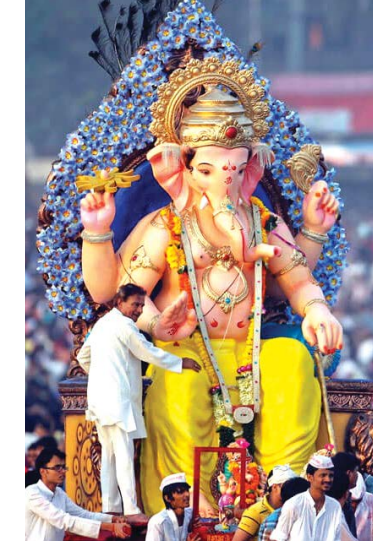
கால மருத்துவ வசதிகள் இருப்பதை உறுதி செய்ய வேண்டும் எனவும் சிலைகளின் உயரம் தரை தளத்தில் இருந்து 10 அடிக்கு மிகாமல் இருக்க வேண்டும் எனவும் மருத்துவமனை, கல்வி நிறுவனங்கள் மற்றும் பிற மத வழிபாட்டு தளங்களுக்கு அருகில் சிலைகள் அமைப்பதை தவிர்ந்தல் வேண்டும் எனவும் தெரிவித்துள்ளார்.

பதில் அருகே தற்காலிக முதலுதவி மற்றும் அவசர