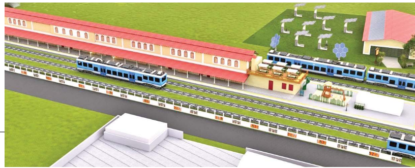
மேட்டுப்பாளையம் ரயில் நிலையம் எப்படி அமைய உள்ளது என்ற மாதிரி புகைப்படம்

தற்போது மேட்டுப்பாளையம் ரயில் நிலையத்தை நாள் ஒன்றுக்கு சராசரியாக 3700 பயணிகள் பயன்படுத்தி வருகின்றனர். இதனிடையே அம்ரித் பாரத் திட்டத்தின் கீழ் மேட்டுப்பாளையம் ரயில் நிலையத்தை ரூ.14.8 கோடி மதிப்பீட்டில் புனரமைக்க முடிவு செய்யப்பட்டு அதற்கான பணிகள் துவங்கியுள்ளன.