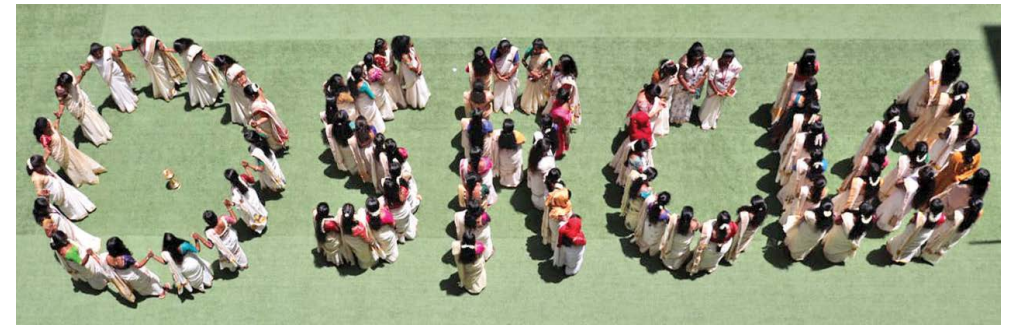
ஸ்ரீ இராமகிருஷ்ணா மகளிர் கலை அறிவியல் கல்லூரியில் ஒணம் விழா கொண்டாட்டம் செவ்வாய்கிழமை நடந்தது. கல்லூரி மாணவிகள் ஒணம் பண்டிகையை அத்திப்பூ கோலமிட்டும் கொண்டாடினர். திருவோண பூக்கோலத்தோடு, கயிறு இழுக்கும் போட்டி, திருவாதிரை நடனம் கலை நிகழ்ச்சிகளுடன் சென்டை மேளமும் இடம் பெற்றது. கல்லூரி மாணவிகள், ஆசிரியர்கள், பணியாளர்கள் ஆகியோர் ஆர்வத்துடன் ஒணம் கொண்டாட்டங்களில் கலந்துகொண்டனர்.