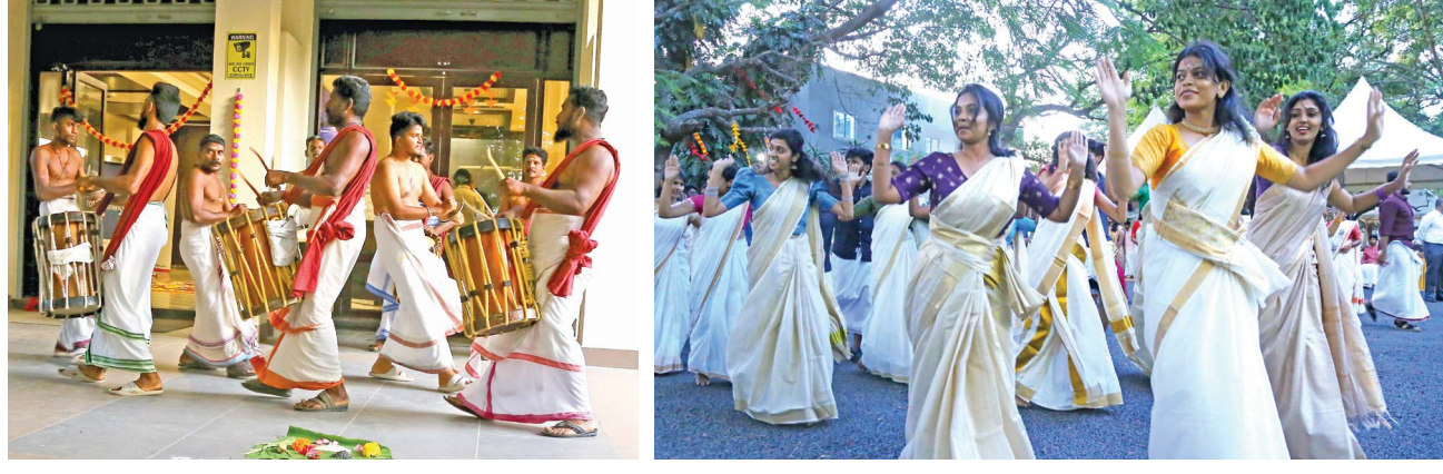
பி.எஸ்.ஜி இன்ஸ்டிடியூட்டில் அல்பி மேனேஜ்மென்ட் கல்லூரியில் கேரளாவின் பாரம்பரிய திருவிழாவான ஒணம் வெகுவிமரிசியாக வெள்ளிக்கிழமை கொண்டாடப்பட்டது. இந்நிகழ்வில் மாணவ மாணவிகள் கேரளாவின் பாரம்பரிய உடை அணிந்தும் பூக்கோலம் இட்டு திருவாதிரை நடனமாடினர். மாணவர்களுக்கிடையே பல்வேறு போட்டிகள் நடைபெற்றது. அதனைத் தொடர்ந்து மன்னர் மகாபலி நாடகம் நடத்தப்பட்டது. இதில் மாணவர்கள் உற்சாகத்துடன் கலந்துகொண்டனர்.