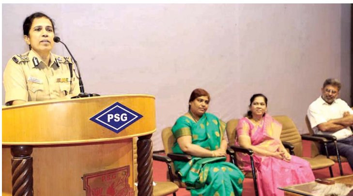
மாணவர்களிடம் ராகித் தடுப்பு விழிப்புணர்வு குறித்து உரையாற்றுகிறார் மேற்கு மண்டல ஐ.ஜி பவானீஸ்வரி.