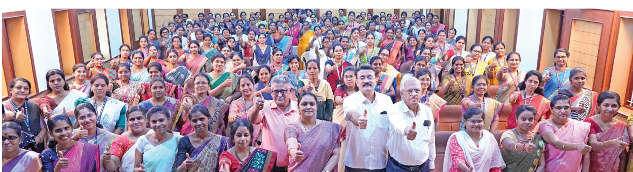
விழிப்புணர்வு நிகழ்வில் எஸ்.என்.ஆர் கல்வி நிறுவனங்களின் பேராசிரியர்கள் எடுத்துக் கொண்ட குழு புகைப்படம்