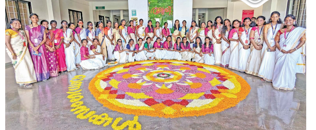
எஸ்.என்.எஸ் கல்வி குழுமங்களின் அனைத்து கல்லூரிகளிலும் ஒணம் பண்டிகை வெள்ளிக்கிழமை கொண்டாடப்பட்டது. இதில் உரி அடித்தல், கயிறு இழுத்தல் என பல போட்டிகளுடன் சென்டை மேளம், சிங்காரிமேளம் என இசை முழங்க ஆயிரக்கணக்கான மாணவர்கள் பங்கேற்று திருவோணத்தை வரவேற்றனர்.