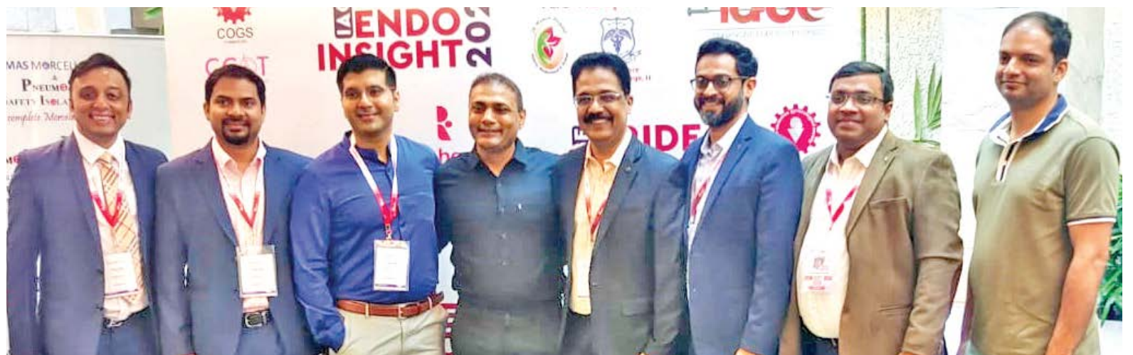
Gynaecologists participated in "IAGE Pride Endo Insight 2023" conference organized by Rao Hospital