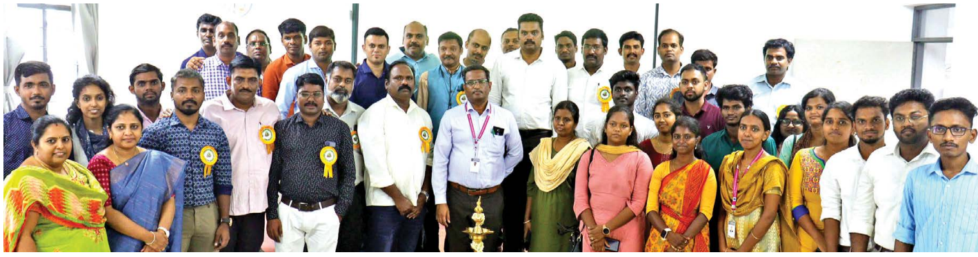
Doctors of KMCHCOT and TNAIOTA along with students of KMCHCOT