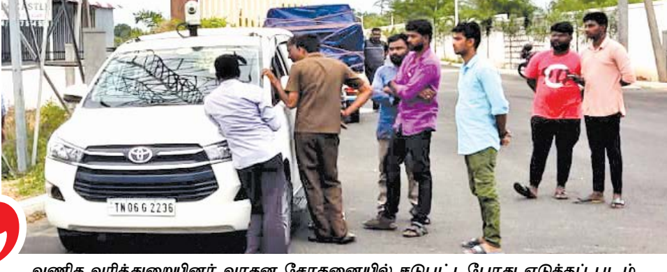
வணிக வரித்துறையினர் வாகன சோதனையில் ஈடுபட்டபொழுது எடுத்தப் படம்

இன்றைய காலகட்டத்தில் இந்த ஜி.எஸ்.டி. கண்காணிப்பில் இருந்து யாருமே தப்பிக்க முடியாது என்ற நிலை வந்துவிட்டது. அப்படி இருக்கும்பொழுது ஜி.எஸ்.டி. நடைமுறை குறித்த சட்டங்கள் இன்னும் தெளிவாக மக்களையோ, வணிகர்களையோ, தொழில் சார்ந்த அமைப்புகளையோ, தொழில் செய்பவர்களையோ சென்றடையவில்லை என்பதுதான் உண்மை. அந்த நிலையில் இதுகுறித்த வழக்குகளையும் அதிகாரங்களையும் சரியாகப் பயன்படுத்த வேண்டியது ஜி.எஸ்.டி. துறை சார்ந்த அதிகாரிகளின் கடமையாகும்.