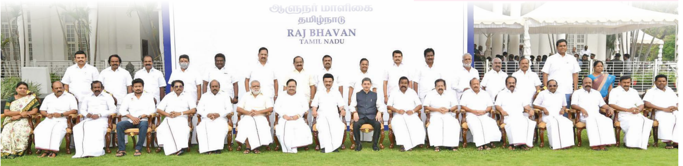
ஆளுநர் மாளிகை தமிழ்நாடு RAJ BHAVAN TAMIL NADU

ஆனால் தற்பொழுது அதையும் மீறி நாசரை அமைச்சர் பதவியில் இருந்து இறக்கியதற்கு வேறு காரணங்களும் இருக்கிறது. ஒருவேளை நாசர் மற்றும் அவரது மகன் மீது உள்ள குற்றச்சாட்டுகளையும் புறம்தள்ளி சமூகத்தை காரணம் காட்டி அவரை அமைச்சர் பதவியில் தொடர வைத்திருந்தால் அது திமுகவின் ஹிந்து வாக்குகளில் நஷ்டத்தை ஏற்படுத்தி இருக்கக்கூடும். அண்ணாமலை தற்போதைய காலகட்டத்தில் செய்துவரும் அரசியலால் பெரிய அளவு பாதிப்பு இல்லை என்றாலும் சிறிய அளவிலாது ஹிந்து ஒற்றுமை என்பது ஏற்பட்டுள்ளது. அதையும் கணக்கில்கொண்டுதான் நாசரை அமைச்சர் பொறுப்பில் இருந்து வெளியேற்றினார் முதல்வர் மு.க.ஸ்டாலின்.