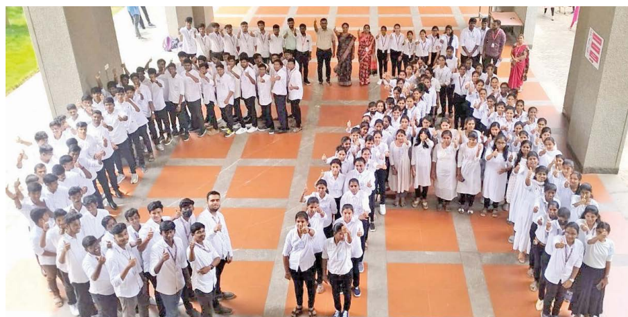
Students line up to mark Chartered Accountants Day

With approximately 150 students in attendance, the event successfully created an enriching experience for all participants, leaving a lasting impact on their academic and professional journeys.