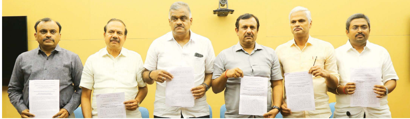
பத்திரிக்கையாளர்கள் சந்திப்பில் பங்கேற்ற உற்பத்தியாளர்கள் சங்கத்தினர்.

பஞ்சின் மீது விதிக்கப்பட்ட 11% இறக்குமதி வரியால் உள்நாட்டு பஞ்சு நிலை 15 சதவீதம் உயர்ந்துள்ளது. வங்கிகளின் வட்டி விகிதமும் 11 சதவீதமாக உயர்ந்ததால் நூல் உற்பத்தி செலவு கிலோவுக்கு ஆறு ரூபாய் வரை உயர்ந்துள்ளது. மேலும் மின்சாரக் கட்டணம் உயர்வு, வருடாந்திர மின் கட்டண உயர்வு, பீக்ஹவரின் நேரம் மற்றும் மின் கட்டண உயர்வால் நூற்பாலைகளின் உற்பத்திச் செலவு கிலோவுக்கு ஐந்து ரூபாய் வரை உயர்ந்துள்ளது.