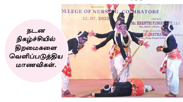
நடன நிகழ்ச்சியில் திறமைகளை வெளிப்படுத்திய மாணவிகள்.

இப்போட்டிகளில் கோவை, நீலகிரி மாவட்டத்திலுள்ள 35 செவிலியம் சார்ந்த கல்லூரிகள் மற்றும் பள்ளிகளிலிருந்து பதிவு செய்யப்பட்ட சுமார் 1,200 செவிலிய மாணவ மாணவிகள் சிகை அலங்காரம், காய்கறி செதுக்குதல், கோலமிடுதல், பேச்சு, நடனம், கட்டுரைப் போட்டி என 16 தனி மற்றும் குழுப் போட்டிகளில் தங்கள் திறமைகளை வெளிப்படுத்தினர்.