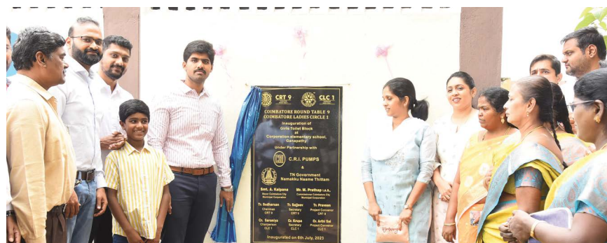
Prathap, I.A.S. Commissioner, Coimbatore City Municipal Corporation inaugurated the newly constructed Toilet block for Girls and the renovated classrooms at Corporation Elementary School in Ganapathy

The school has been experiencing a high influx of new students, and the headmistress and teachers are committed to providing quality education. C.R.I. is proud to be associated with the school and looks forward to further collaborations for its development and progress.