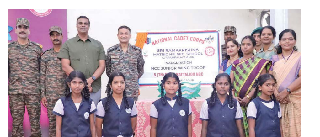
துவக்க விழாவில் குழுவாக புகைப்படம் எடுத்துக்கொண்ட மாணவிகள்.

துணிவு, சமூக சேவை, இரக்கம், சகிப்புத்தன்மை, உடற்பயிற்சி போன்றவை அவசியம். மாணவிகளுக்கு இம்மாதிரியான வாய்ப்புகள் கிடைப்பது அரிது. இதை சரியாகப் பயன்படுத்திக் கொள்ள வேண்டும்' என்றார். பள்ளி முதல்வர் மற்றும் பேராசிரியர்கள் கலந்துகொண்டனர்.