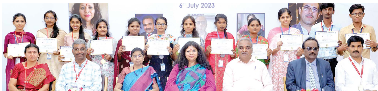
என்.ஜி.பி. கலை கல்லூரி நட்சத்திர அறிவியல் போட்டியில் வெற்றிபெற்ற மாணவர்களுக்கு சான்றிதழ்களை வழங்கிய ஐ.பி.டி. நட்சத்திரக் கல்லூரி திட்ட ஆலோசனைக் குழு.