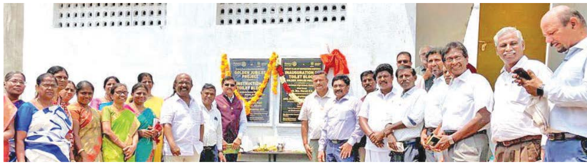
Members of the Rotary Club of Coimbatore Midtown with the Principal and Teachers near the newly inaugurated Toilet Building for students of Kuniyamuthur High School.