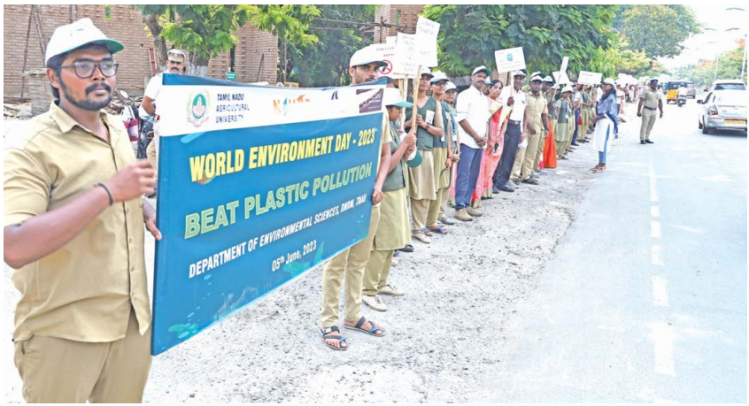
TNAU Students hold placards with the theme "BEAT PLASTIC POLLUTION" to create awareness about the issue of Plastic Pollution