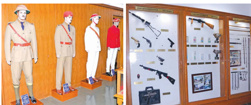
போலீஸ் அருங்காட்சியகத்தில் இடம்பெற்றுள்ள காவலர் சீருடைகளின் பரிணாமம். (அடுத்தபடம்) காவல் துறை படைக்கலங்கள்.

இங்கு தரைப்படை, கப்பல் படை விமானப்படை, என முப்படியினர் பயன்படுத்திய பொருள்கள் ட்ரெய்னிங் ஏர் கிராப்ட் சிறிய ரக விமானம் போன்றவை காட்சிப்படுத்தப்பட்டுள்ளது. கார்டில் போரில் பயன்படுத்திய பிரங்கி டி 55 டேங்க், போலீசாரின் துப்பாக்கி தோட்டாக்கள் ஐய்வு பெற்ற அதிகாரிகள் பயன்படுத்திய துப்பாக்கிகள் பொதுமக்கள் சுய பாதுகாப்பிற்காக பயன்படுத்திய துப்பாக்கிகளும் வரிசைப்படுத்தப்பட்டுள்ளது.