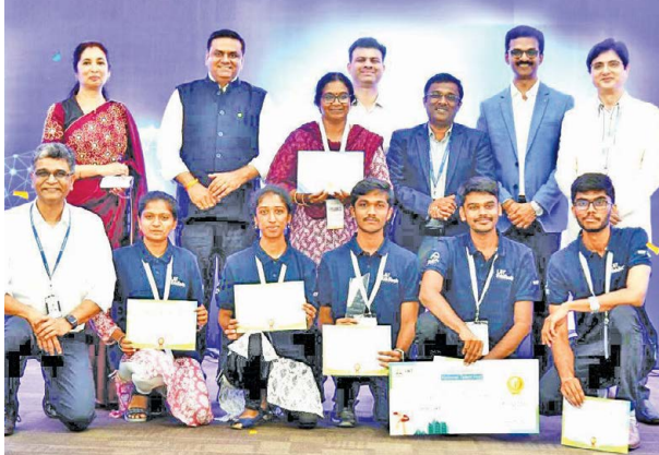
ECE Students of KPR Institute win 1st Prize for their "Smart Health Monitoring Robot" Project

Their outstanding achievement highlights their innovative approach to solving real-world challenges and signifies the bright future of engineering talent in India.