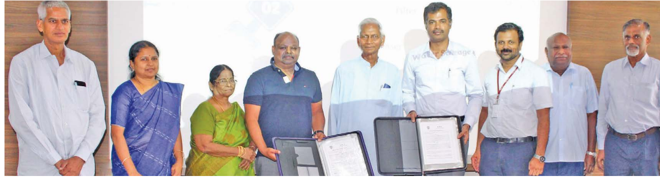
MoU Exchange between PSGiTech and A & A Consulting Services Ltd (UK)