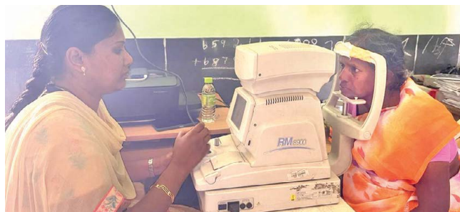
Public involved in eye checkup by Vasam Eye Care at Panchayath Union Primary School Medical Camp organized by Rotary Coimbatore Infra.