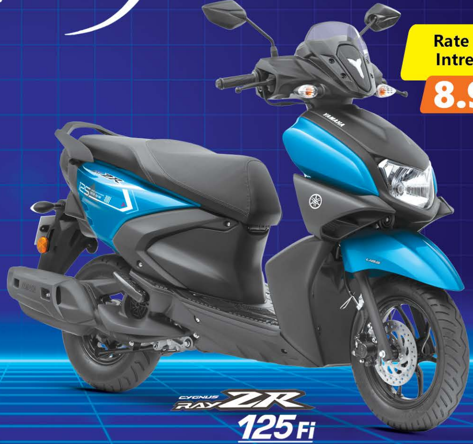
CYGNUS RAY ZR 125 Fi