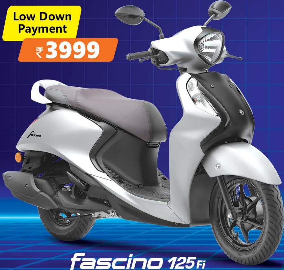
fascino 125 Fi