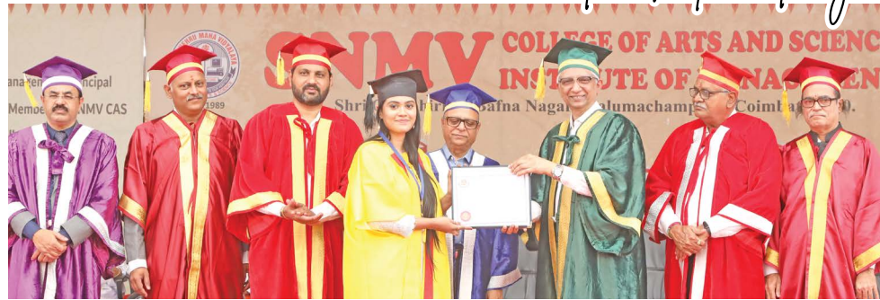
The Chief Guest honouring the Rank Holder