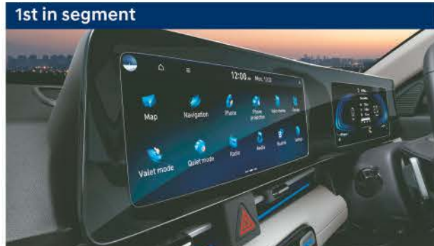
1st in segment Integrated 26.03 cm (10.25") HD infotainment & digital cluster with color TFT MID