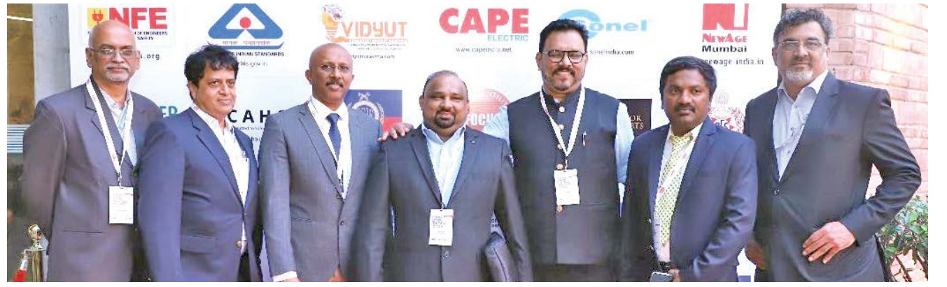
மாநாடு நிகழ்வின் போது என்.எஃப்.இ அமைப்பின் தலைவர், செயலாளர் மற்றும் குழுவினர்களுடன் எடுத்துக்கொண்ட குழு புகைப்படம்.