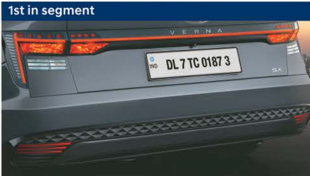
1st in segment Parametric connected LED tail lamps