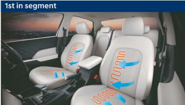
1st in segment Front ventilated & heated seats