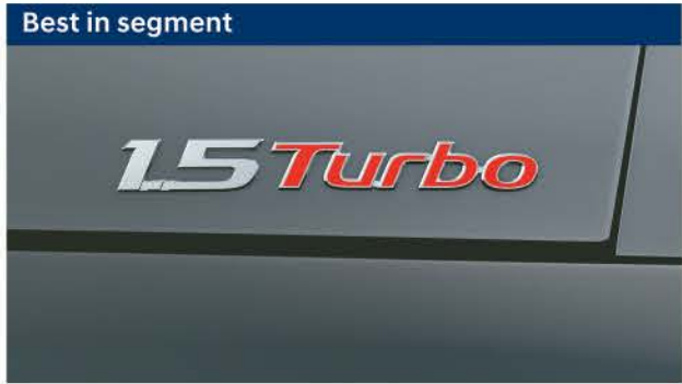
Best in segment Powerful 1.5 l turbo GDi petrol - 117.5 kW 7-speed DCT & 6-speed MT