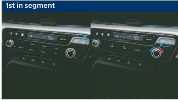
1st in segment Switchable type infotainment & climate controller