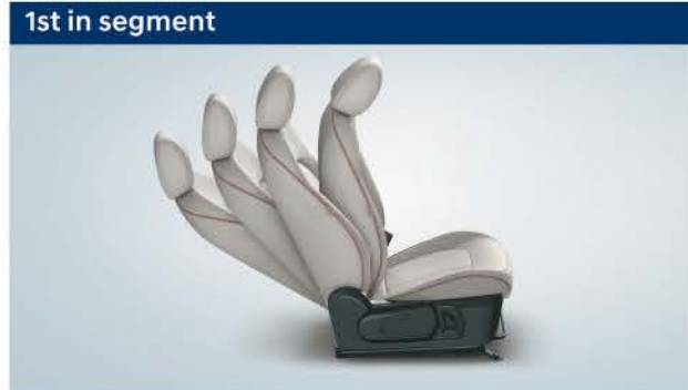
1st in segment Power driver seat