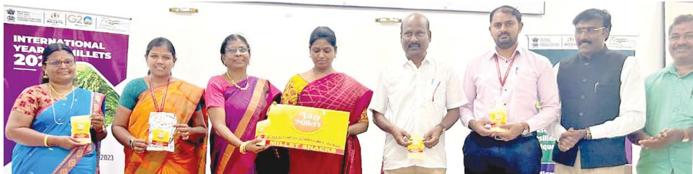
The chief guests releasing 10Rs. Millets Snacks packets