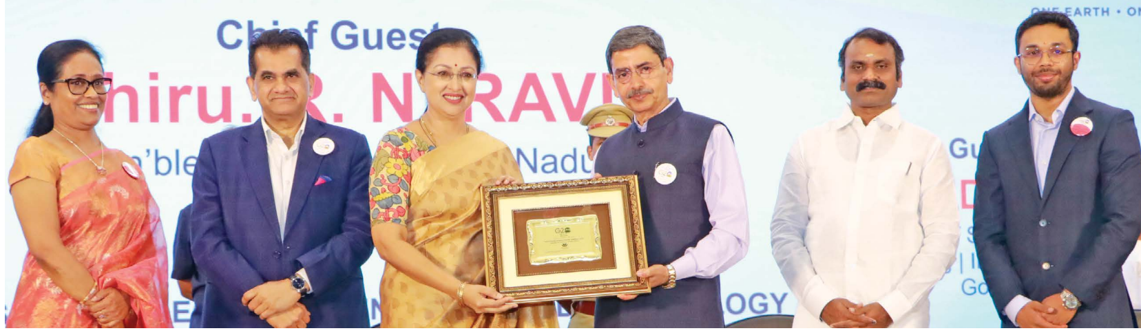
The Governor R.N. Ravi honouring the Gautami Tadimalla, Indian Actress BJYM Vice President

"The world is facing many challenges like climate change, poverty, destruction of biodiversity, food and undernourishment, health and India can offer a ray of hope to address many of these issues", added Murugan