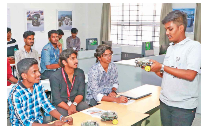
PSG student teaching various college students in a workshop